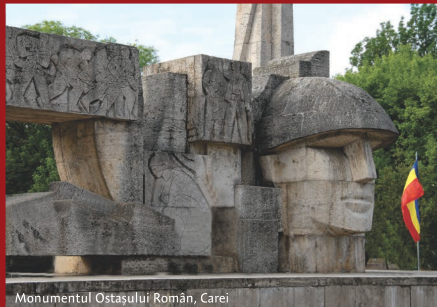
Monumentul Ostașului Român, Carei